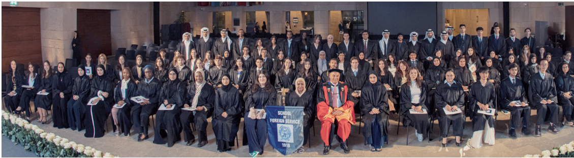
GU-Q staff and students during New Student Convocation ceremony.

Convocation is a revered tradition that also introduces students and their families to Georgetown's history, cherished traditions, and foundational values. It underscores the commitment